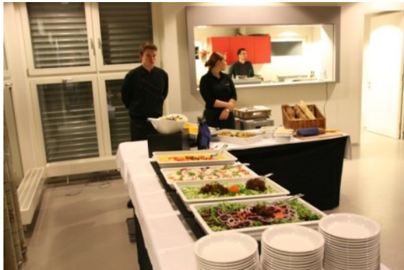
Buffet (Beispiel) 60 Personen