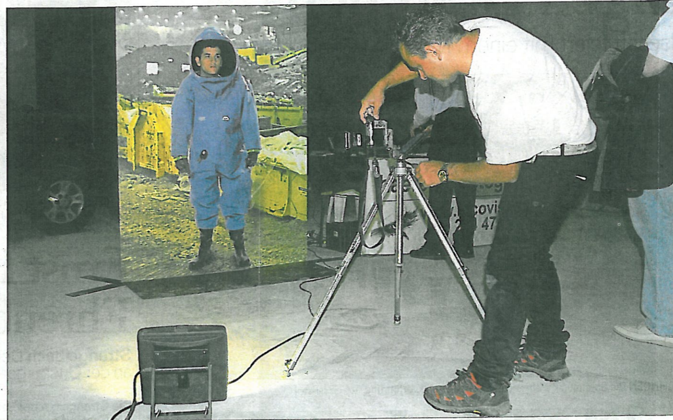
ERINNERUNGSFOTO Viele Besucher liessen sich im Schutzanzug fotografieren. NADIA RAMBALDI

Der Tag der offenen Tür in der Sondermülldeponie lockte am Samstag mehrere Hundert Besucherinnen und Besucher nach Kölliken. Diese konnten sich im Labor, in der Lagerhalle, Abbauhalle und in der Manipulationshalle über den Stand des Rückbaus der Abfälle informieren.