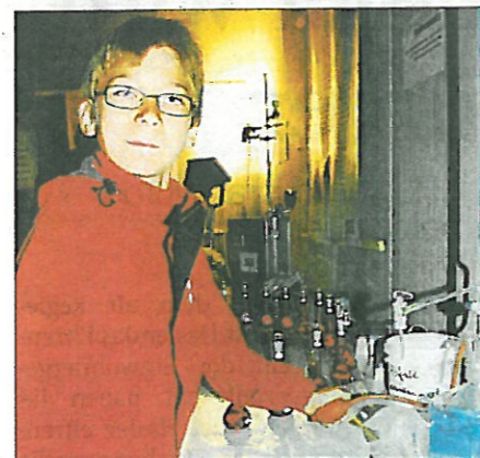
SPANNEND Probieren geht über Studieren.